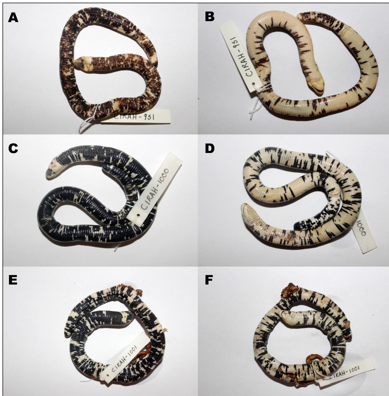
Figura 1. Especímenes de Amphisbaena fuliginosa de la ciudad de Riberalta, Beni, Bolivia. A-B: vista dorsal y ventral del espécimen CIRAH-951; C-D: vista dorsal y ventral del espécimen CIRAH-1000; E-F: vista dorsal y ventral del espécimen CIRAH-1001.

El diseño y coloración de Amphisbaena fuliginosa , así como algunas características merísticas de la especie varía de una región a otra en Sudamérica (Vanzolini, 1951; Vanzolini, 2002a; Roberto et al. , 2021). Predominantemente de hábitos fosoriales y ocasionalmente sale a la superficie (Vanzolini, 2002a, b; Lemos y Facure, 2007; Nogueira-Costa et al. , 2013). Se alimentan principalmente de hormigas (Formicidae) y termitas (Isoptera) (Esteves et al. , 2011).